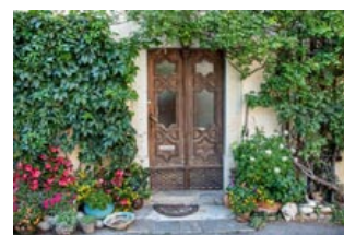
OberGraz, pictfy, Gasser & Gasser (2)