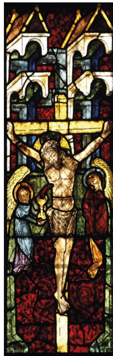
Glasfenster in der Kirche Maria Straßengel

In der Karfreitagspraxis gibt es Unterschiede: Soweit ich sehe, wird in der katholischen Kirche der Karfreitag als schlichter, stiller Wortgottesdienst gefeiert, mit dem Hören auf die Leidensgeschichte Jesu im Zentrum. In evangelischen Karfreitagsgottesdiensten feiern wir immer das Abendmahl mit Sündenbekenntnis und Vergebungszuspruch. Ich habe als junger Pfarrer aus Faszination für die katholische Form des Karfreitagsgedenkens ein-