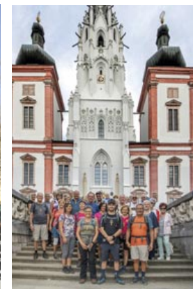
Fußwallfahrt zum Schlüsselfest Rein, 27. April