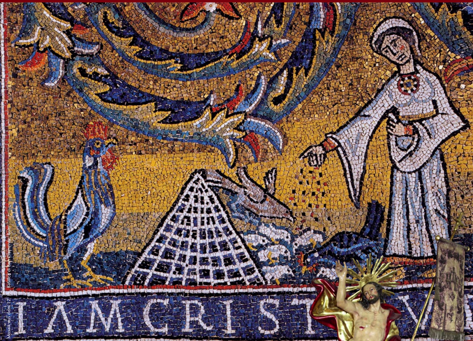
Mosaik aus dem 12. Jhr., Basilika di San Clemente, Rom