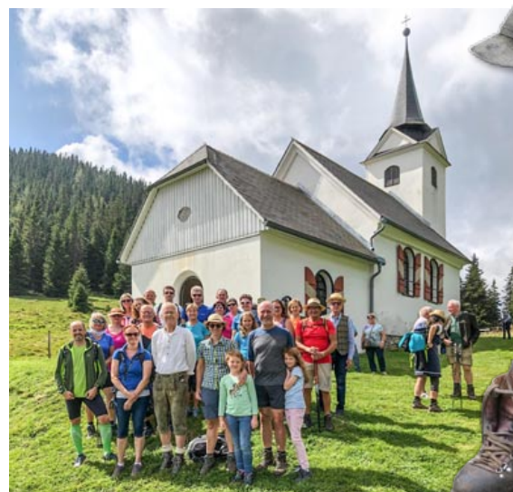
Fußwallfahrt auf die Gleinalm, 24. August