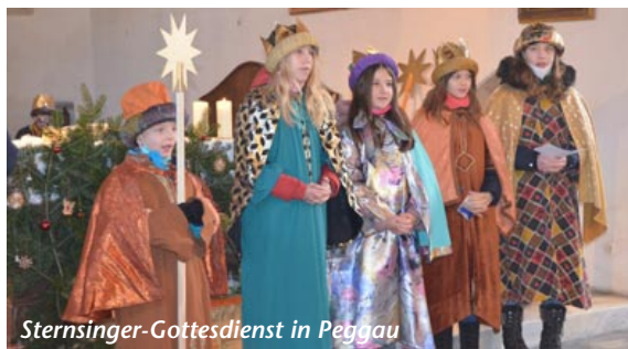
Sternsinger-Gottesdienst in Peggau

auch das große Sternsingertreffen im Sulmtal und feierte mit Bischof Wilhelm Krautwaschl einen erfrischenden und ermutigenden Gottesdienst. Den krönenden Abschluss bildeten